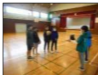
6年生から全校児童への紹介

メジャーリーグで活躍している大谷翔平選手から本校にグローブの寄贈がありました。1月22日の朝会で6年生が全校児童に紹介しました。現在6年生から順番に各クラスで使っています。