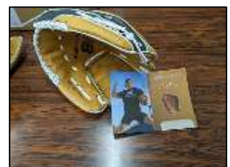
寄贈いただいたグローブ