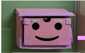
楽しい四のポスト

楽しい四(^O^)/ポストは、東昇降口近く1階第一会議室前の廊下に設置してあります。