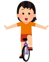
フラフープ・竹馬・一輪車は 学校からお借りしています。

(一輪車は見守るほうがドキドキし ますが、柵につかまり、熱心に練習 しています。)