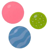
キャンディボール ボール小