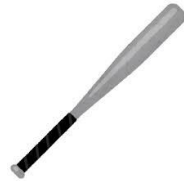
プラスチックのバット